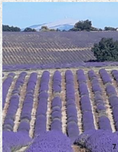
Lavande et Ventoux