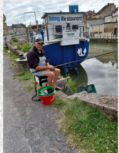
Mon ami le pêcheur