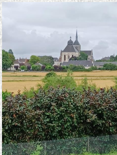
Saint Benoît sur Loire