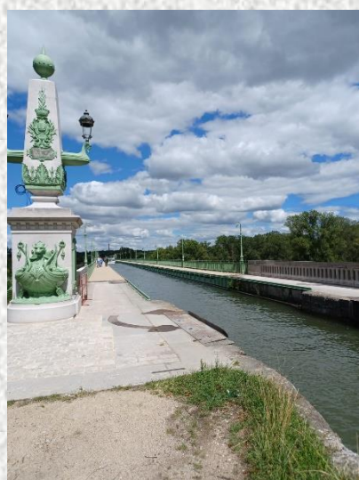
Le pont canal de Briare