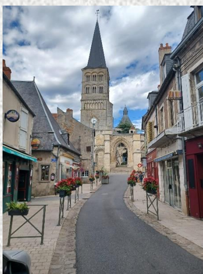
La Charité sur Loire