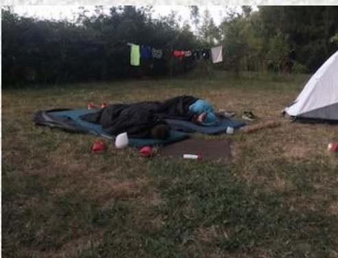
Une nuit à la belle étoile