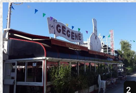
À Joinville le pont, pon pon ! Chez Gégène