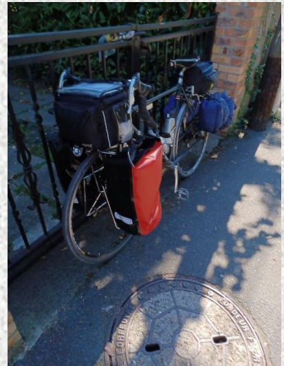
Le même à l'arrivée