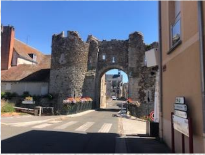
Bonneval - Porte St Roch