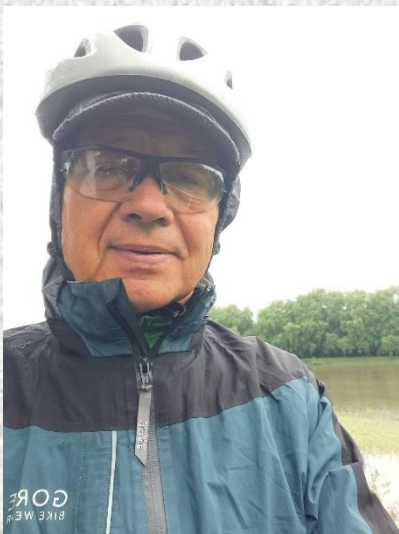
Sous la pluie