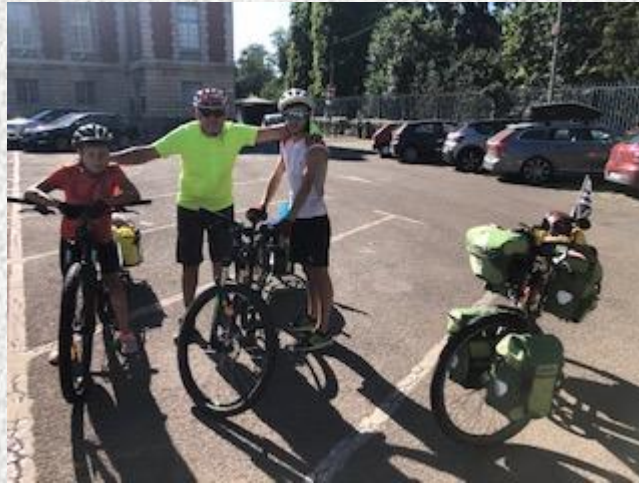
Un Papy HEUREUX !