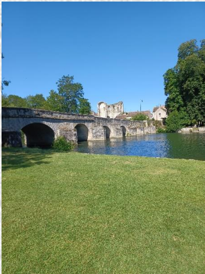
Grez sur Loing