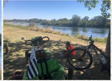
Une dernière journée sur les bords de la Loire