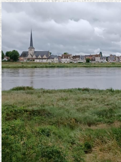
Sully sur Loire et son château