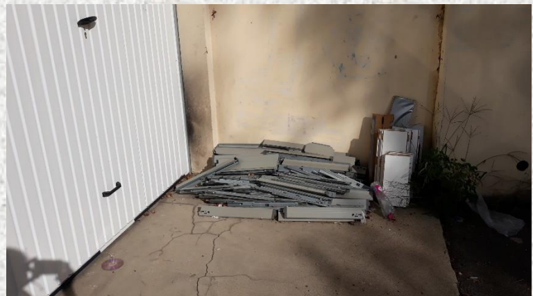
Dépôt sauvage devant l'entrée du garage et herbes folles