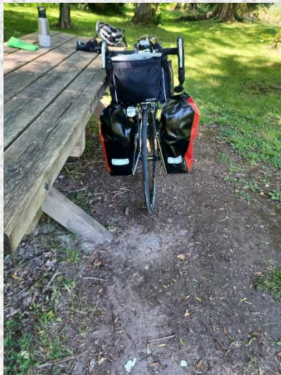
1er bivouac au camping de l'île de Boulancourt