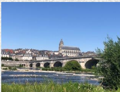
Chaumont sur Loire