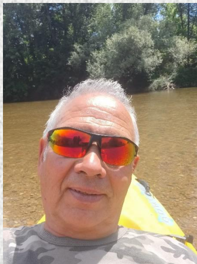
Au soleil !