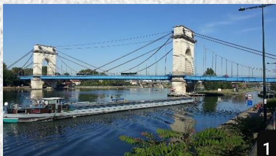
Alfortville Pont du Port à l'Anglais